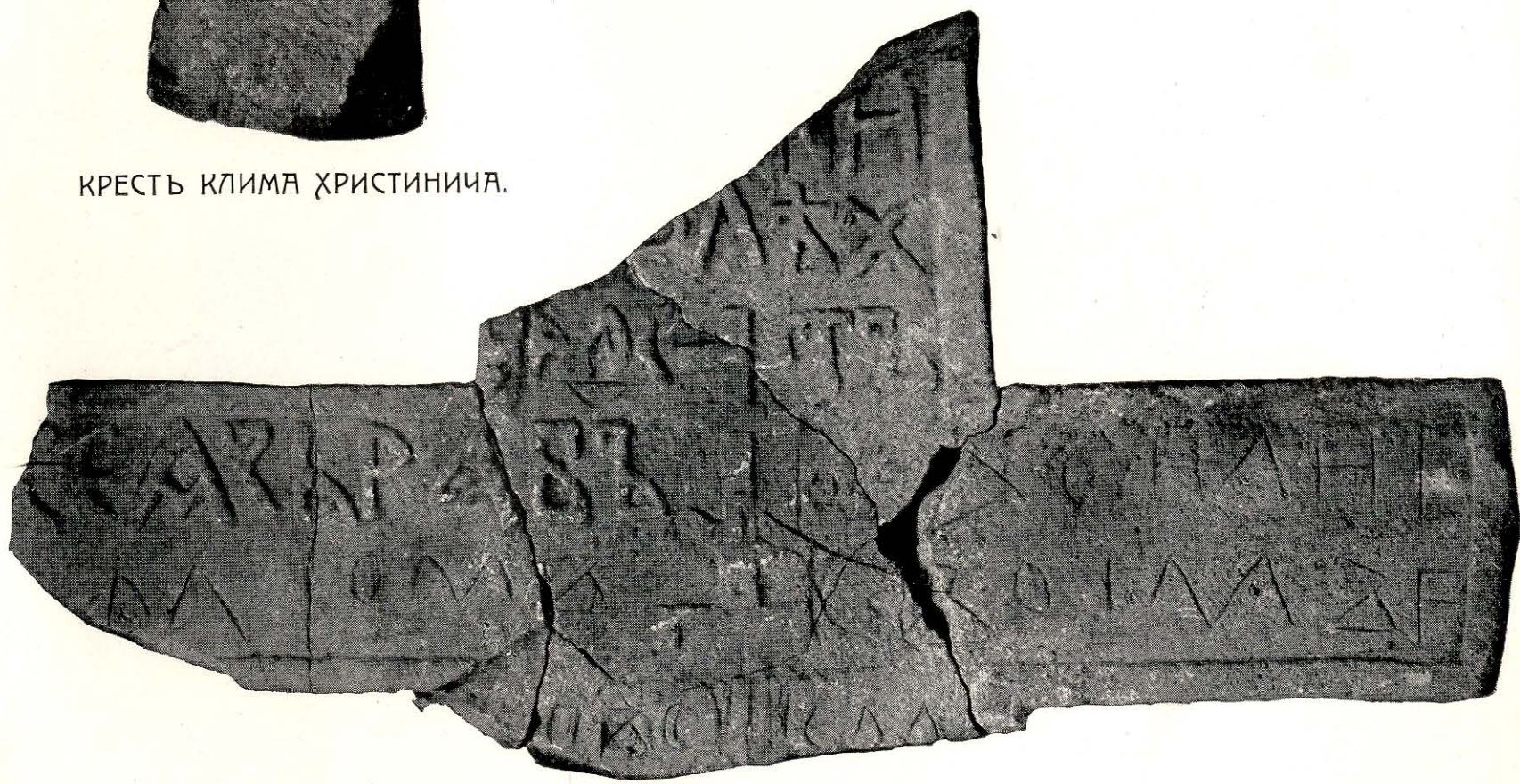
НЕРЕДИЦКІЙ ФРАГМЕНТЪ. XIV—XV В.